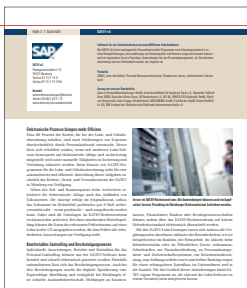
Firmenporträt 1/1 Seite