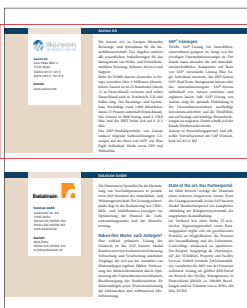
Firmenporträt 1/2 Seite