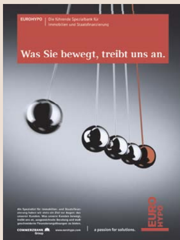
Anzeige 1/1 Seite