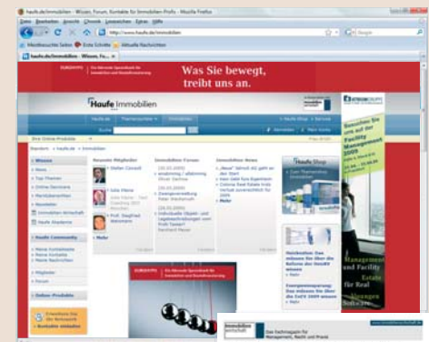
Ihre Online-Werbemöglichkeiten Bannerwerbung oder Newsletteranzeigen