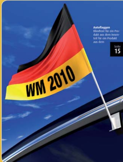
Autoflaggen Blindtext für ein Pro- dukt aus dem Innen- teil für ein Produkt aus dem